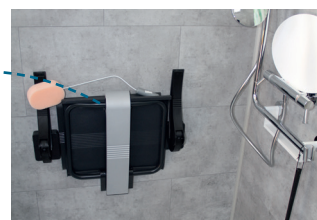
UNE DOUCHE À L'ITALIENNE