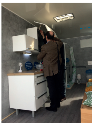
UNE CUISINE MODULABLE