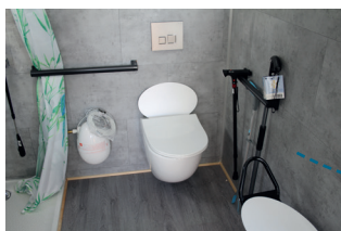
DES WC SUSPENDUS