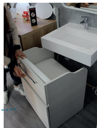
UN LAVABO TRÈS PRATIQUE

Le truck SOLIHA SOLIDAIRES POUR L'HABITAT